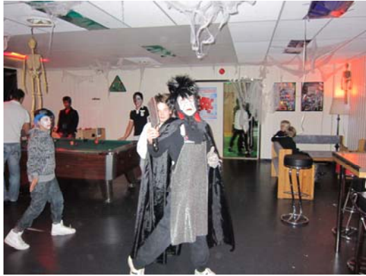
Halloween på klubben