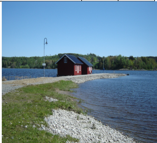
stemningsbilde fra Nes