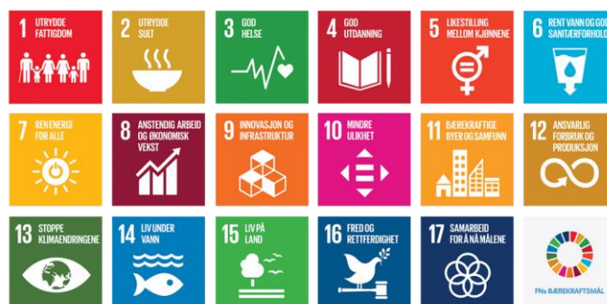
figur 1: FNs 17 bærekraftsmål

Regjeringen har bestemt at FNs 17 bærekraftsmål, som Norge har sluttet seg til, skal være det politiske hovedsporet for å ta tak i vår tids største utfordringer, også i Norge. Det er derfor viktig at bærekraftmålene blir en del av grunnlaget for samfunns- og arealplanleggingen (jf. pbl § 1-1 "Lovens formål" om bærekraftig utvikling).